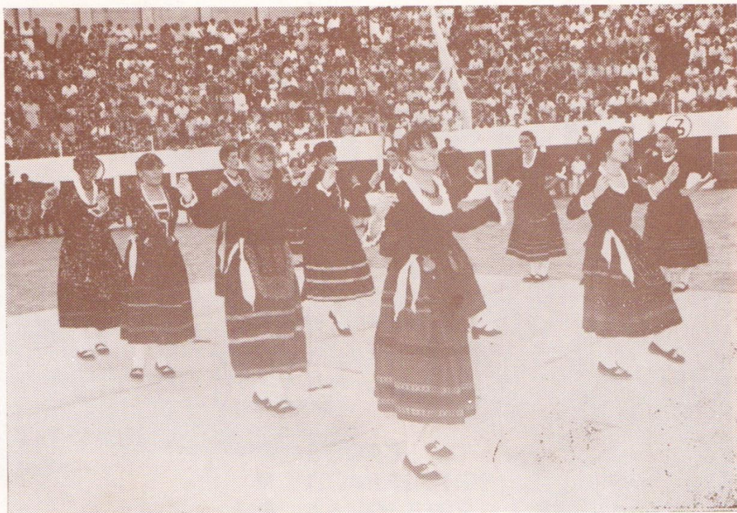
Un grupo del Coro de Danzas de Roa

EL DIA 14 DE AGOSTO INAUGURACION DE LA EXPOSICION DE PINTURA DEL PINTOR LOCAL Y BURGALÉS DEL AÑO JESUS MORAL GONZALEZ , EN EL SALON DE ACTOS DEL AYUNTAMIENT- TO Y EN LAS ESCUELAS DE LA CAVA.