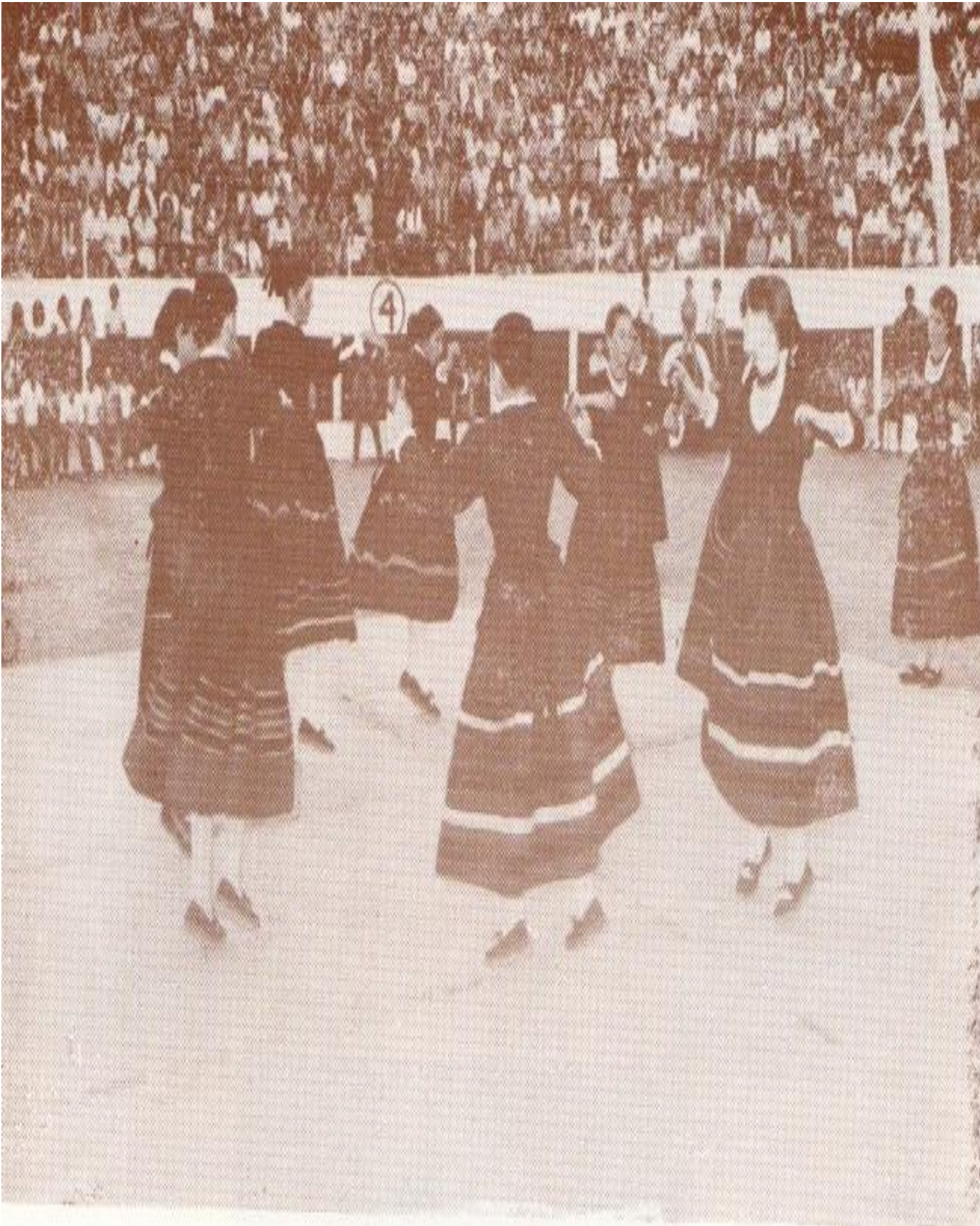
Un grupo de Coros y Danzas de Roa